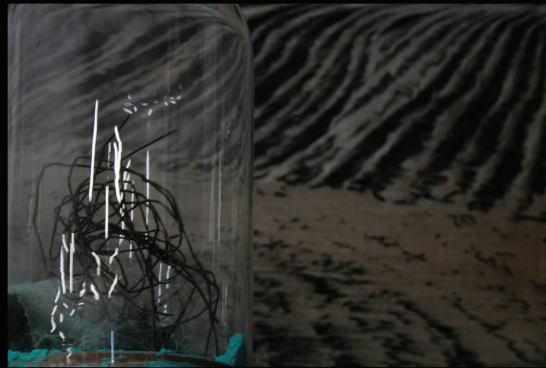
VENIRE (ELJÖVENDŐ), RÉSZLET, LENVÁSZON, KRÉTAPOR, MÉSZ, SZÉN, ENYV, LENOLAJ, ÜVEGBÚRA, DRÓT, FA, PIGMENSPOR, 100x100 cm, 70x100 cm, 2024