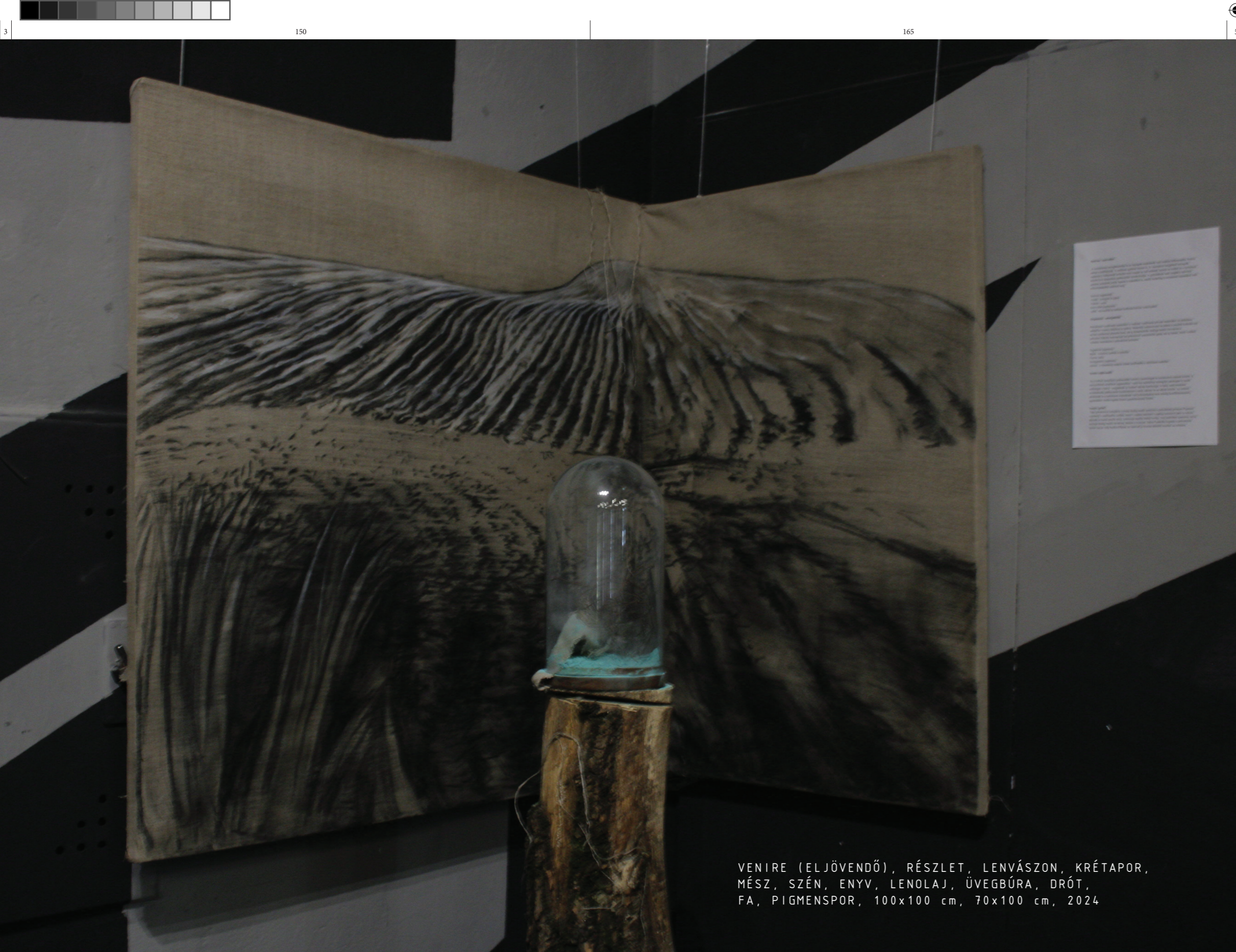
VENIRE (ELJÖVENDŐ), RÉSZLET, LENVÁSZON, KRÉTAPOR, MÉSZ, SZÉN, ENYV, LENOLAJ, ÜVEGBÚRA, DRÓT, FA, PIGMENSPOR, 100x100 cm, 70x100 cm, 2024